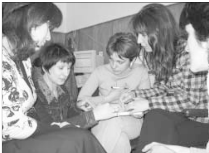
Suuresti meie e-Riigi Akadeemia koostatud Hirveõppe Programmi raames viisid 12 Eesti õpetajat mullu märtsis läbi koolituse, kus õpetati Gruusia pedagoogidele arvuti kasutamist õppetöös.

Oma igapäevaasju toimetades ei mõtle me aga enamasti, kui kasulikud võiksid olla meie viimaste aastate kogemused näiteks neile naabritele, kellega veel 15 aastat tagasi ühte Nõukogude Liitu kuulusime. Meie 20. sajandi ajaloo on mitmeid paralleele, kuid ometigi on arengud kulgenud erinevates suundades. Nõukogulikust mõtteviisist vabanemiseks ja