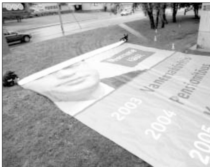
Kodanikuühiskond ja -ühendused on erakondade senistes valimislubadustes küllaltki tagaplaanil olnud. Vabaühenduste manifest ulatab selles osas erakondadele abikäe.

Projekti rahastavad Avatud Eesti Fond ja Balti-Ameerika Partnerlusprogramm.