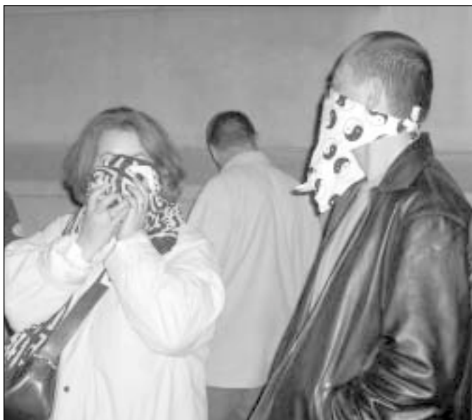
23. oktoobril tähistatud 1956. aasta ülestõusu aastapäev tõi taas kaasa kokkupõrked Ungari politsei ja rahva vahel. Kaitseks pisaragaasi eest kandsid meelevaldajad näo ees rätikuid.

Hetkeolukord kätkeb endas tugevat potentsiaali uudseteks lahendusteks, kuid samas ka ohtlikeks eksperimentideks. Jääb üle soovida vennasrahva ühendustele jõudu ja ideid tekkinud olukorda mõistlikult ja vastutustundlikult kasutada.