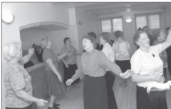
Poska tänaval asuva maja ees ja sees käib pidevalt vilgas sagimine. Pildil toimub parasjagu seniortantsu tund.

Piisab vaid mööduda ruumist, kus parajasti käib prouade võimlemisring, veendumaks, et kahtlused olid asjatud – ukse tagant kostev kilkamine meenutaks pigem gümnaasiumi-plikade kehalise kasvatuse tun-di. “Meil käib siin ekstra elurõõmus seltskond,” sõnab Veiper. Ning tõtt öelda, ega ta selliseid virisevaid vanureid, keda meedia enamasti kajastama kipub, ka mujal kohta.