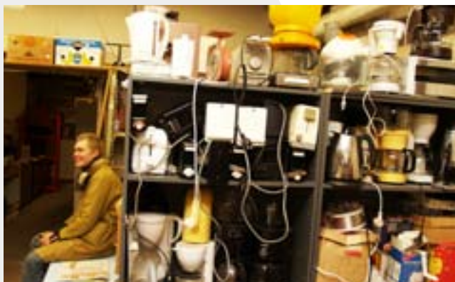
Muuhulgas müüb Taaskasutuskeskus täiesti töökorras koduelektroonikat.